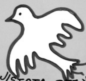
JISTOTA BEZ VÝSLEDKU